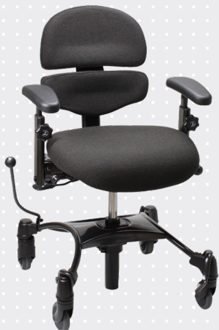
VELA Tango 500