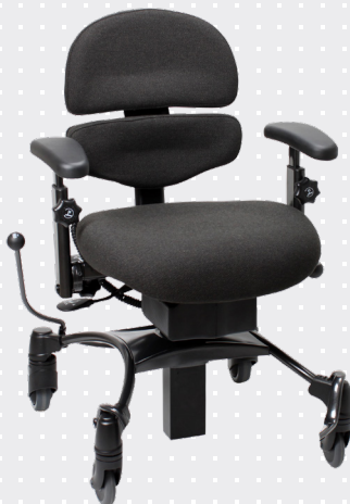
VELA Tango 500EL