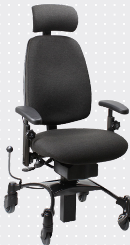
VELA Tango 510EL