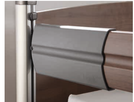
Technisch geavanceerd en optisch perfect: De telescopische zijafscherming: voor standaard en speciale lengtes