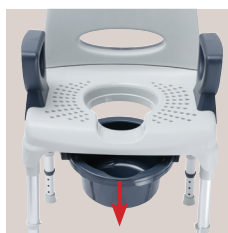
Emmer van voren afneembaar